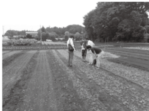
生育状況を確認の様子

作付け2年目の今年は販売にも力を入れ、関係機関や内部での協議を行い、オリジナルのパッケージ袋を作成し「 彩にんじん みなみ 南ちゃん 」として、市場やJA直売所・インショップなどでの販売をめざし、日々活動を行いJA南彩の新たな特産品になるよう努めております。店頭で見かけた際には、是非手に取りご賞味下さい。